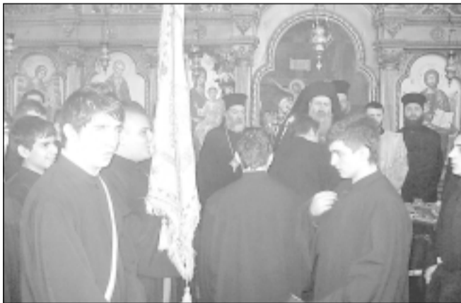
Петокурсниците целунаха семинарското знаме и взеха благословение от дядо Ректора