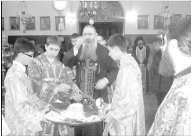
Момент от облачението на епископа в храма преди началото на св. Литургия