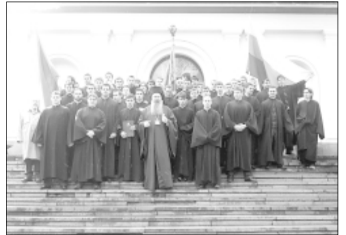
Великият еп. Сионий със семинаристите от пети и четвърти курс пред сградата на Семинарията