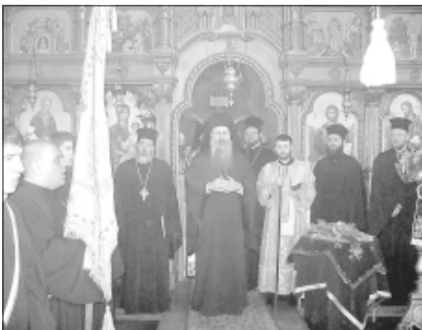
Св. Благовещение. Предаване семинарското знаме от завършващия випуск (вдясно) на следващия курс (вляво)