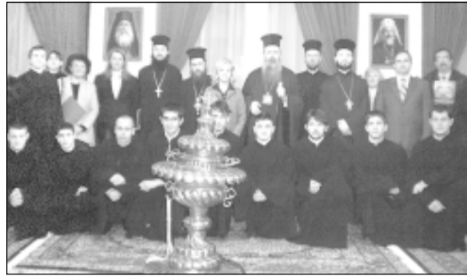
Участниците в конференцията „Християнска София“

Така накратко споменахме за Софийските светци, които са наши застъпници всеки ден пред Всеподателя. И ние като граждани на град София трябва да се стремим да им подражаваме и винаги да бъдем твърди в нашата православна вяра.