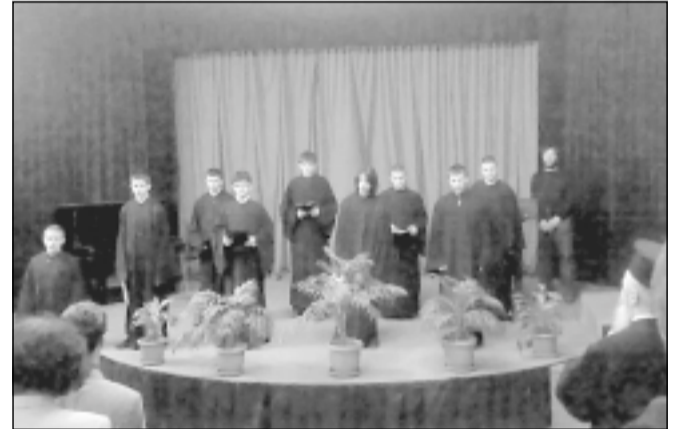
Участниците в рецитала в чест на празника