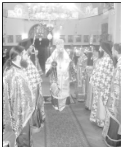
Св. Благовещение. Тържествена св. Литургия в семинарския храм