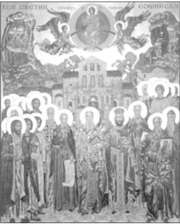
Събор на всички Софийски светци. Икона от семинарския храм „Св. Йоан Рилски“