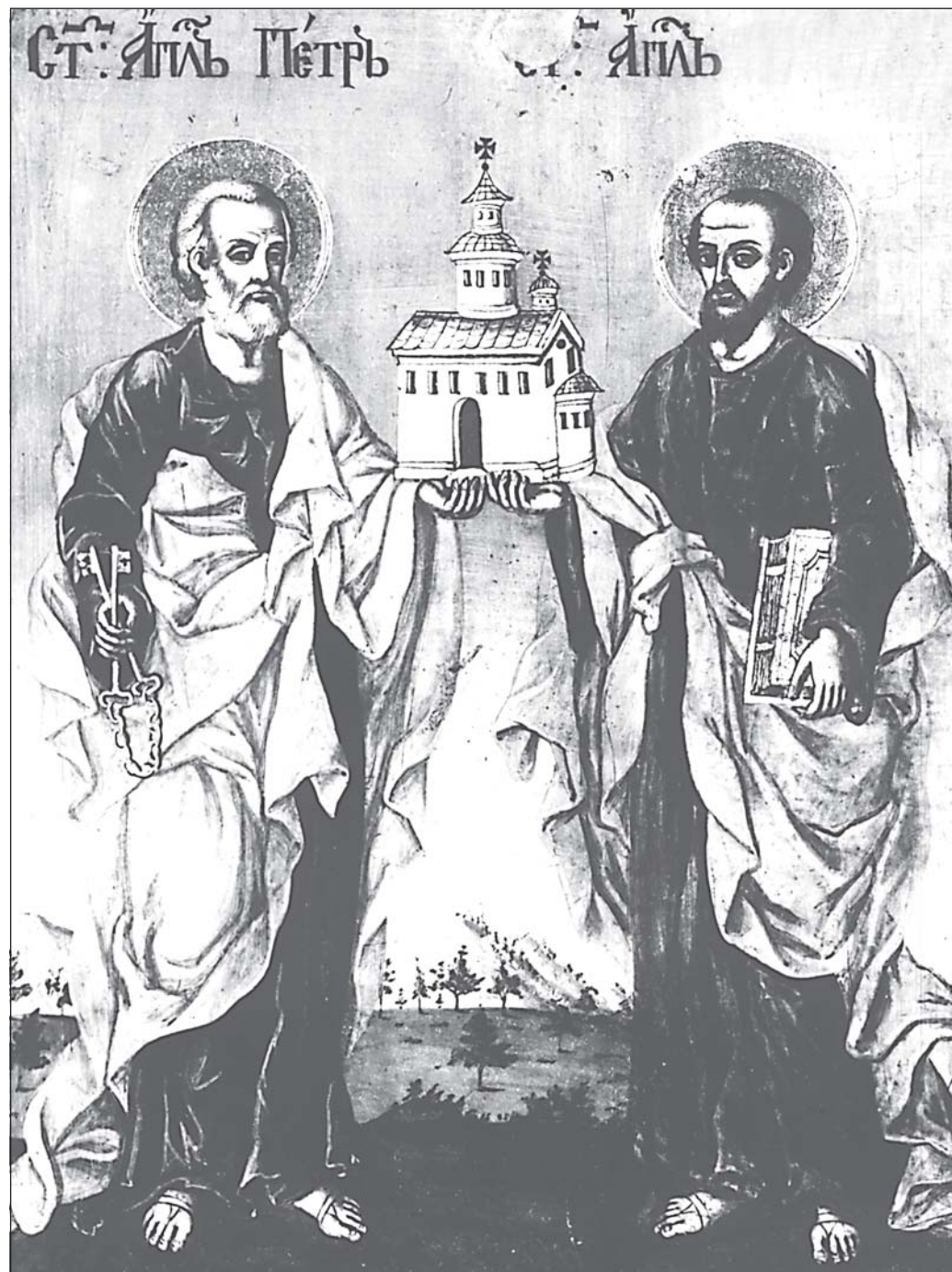
Светите апостоли Петър и Павел

Икона от църквата „Св. Троица“ в гр. Банско, Банска художествена школа, края на XIX в.