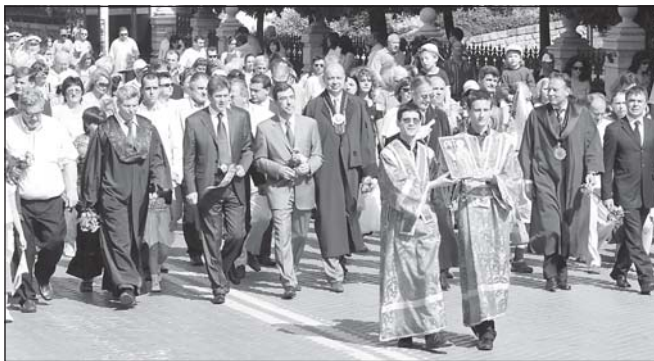
Празничното шествие на 24 май 2006 г.

ки участници в празника се събраха на тържествения акт при паметника на светите братя Кирил и Методий пред