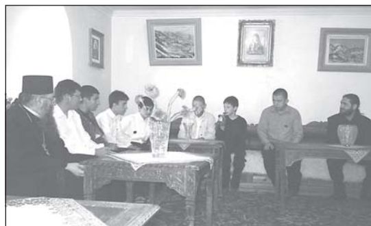
Семинаристите от II а курс по време на разговор с игумена на Рилския манастир Адрианополски епископ Евлогий

Икона от църквата „Св. Троица“ в гр. Банско, Банска художествена школа, края на XIX в.