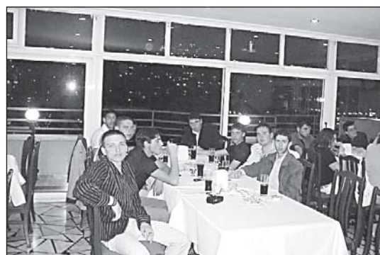
Абитуриентски бал на семинаристите от Va и V б курс в ресторанта на хотел „Сюртел“ край гр. Ефес