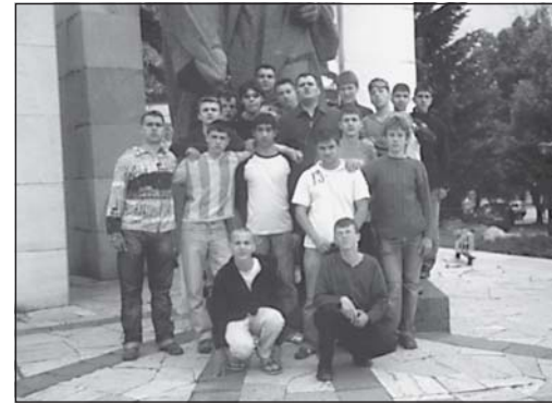
На централния площад в гр. Банско

рушената обител. През 19 в., обаче, св.Георги се явява на сън на мирянин от тогавашното село Хаджидимово и му разкрива, че неговият образ трябва да се извади от земята, като посочва точ- но нахождението му. Човекът не повярвал, но съ- ня се повторил няколко пъти и като отишъл да провери на посоченото място намерил иконата на св. Георги. Оттогава, с много усилия и сред- ства, манастирът се възражда и до ден днешен