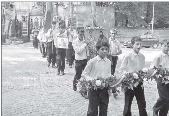
24 май 2006 г. семинарската колона се отправя към катедралния храм „Св. Александър Невски“

Народната библиотека, където Негово Високопреосвещенство Русенският митрополит Неофит и Негово Преосвещенство Знеполски епископ Николай извършиха водосвет и освещаване на паметника. На следващия ден,