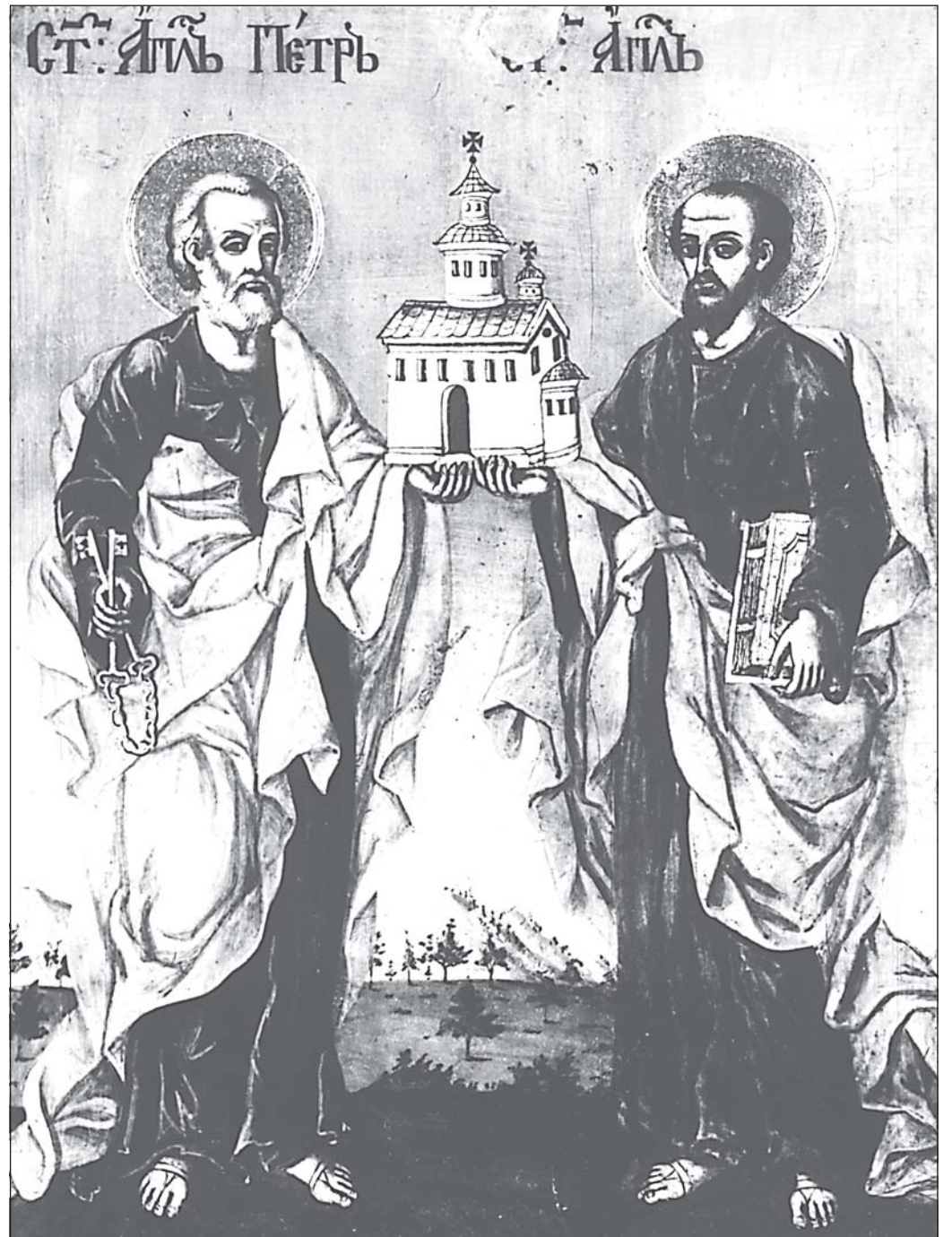
Светите апостоли Петър и Павел

Икона от църквата „Св. Троица“ в гр. Банско, Банска художествена школа, края на XIX в.