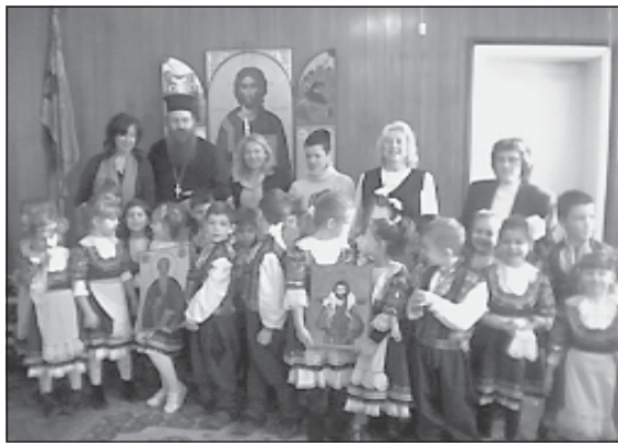
На Игнажден децата първи прекрчиха прага на Ректората на Семинарията