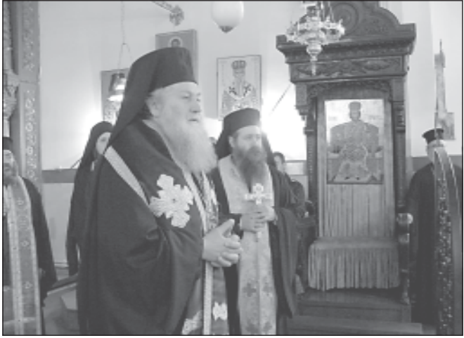
Русенският митрополит Неофит и архимандрит Сионий по време на молебна при откриването на конференцията

От 9 до 11 ноември 2005 г. в Софийската духовна семинария „Св. Йоан Рилски“, с благословението