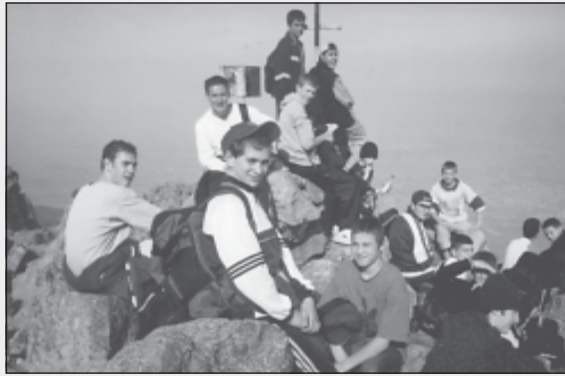
Семинаристи на вр. „Камен дел“, есента на 2004 г.

В Софийската духовна семинария „Св. Йоан Рилски“ наред със задължителната учебна програма се провеждат и много извънкласни дейности и инициативи. Не бих могъл да опиша подробно всичките, но