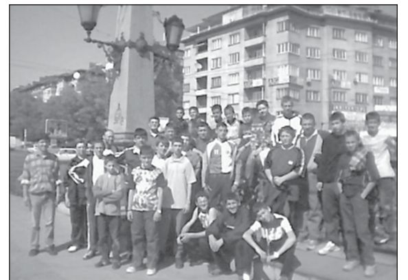
На обиколка из центъра на София, октомври 2004 г.

Най-напред посетихме ПКСХП „Св. Александър Невс-