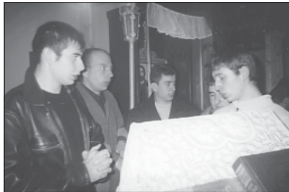
Семинарската певческа група по време на богослужение в църквата „Св. Атанасий летни“, с. Мезек