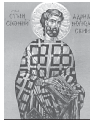
Св. Сионий Български (Адрианополски)

и непознаващи истинския живот на Христа Бога, навлезли в Македония и Тракия и ги превзели, като нападнали и самия престолен град, и го обсадили. После, като дошли