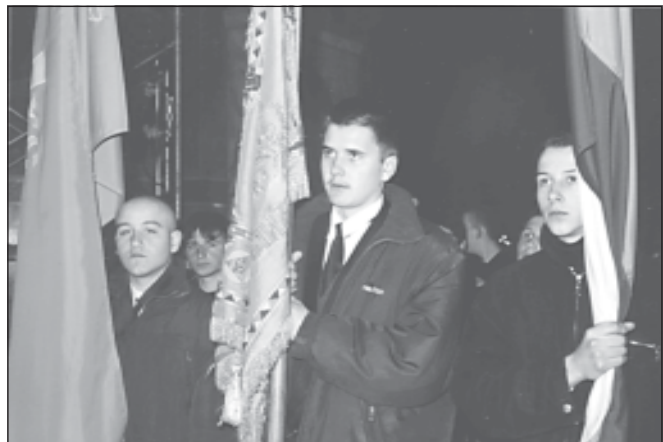
Семинаристи с националния трибагренник и знамената на Семинарията на Националния празник

По случай Националния празник на България – 3 март, с благослението на Негово Светейшес-