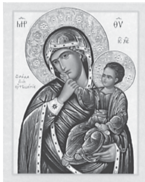
Чудотворната икона на Пресвета Богородица „Отрада“ или „Утешение“, манастира Ватопед, Св. Гора

Духовна поезия на светителя Николай Велимирович