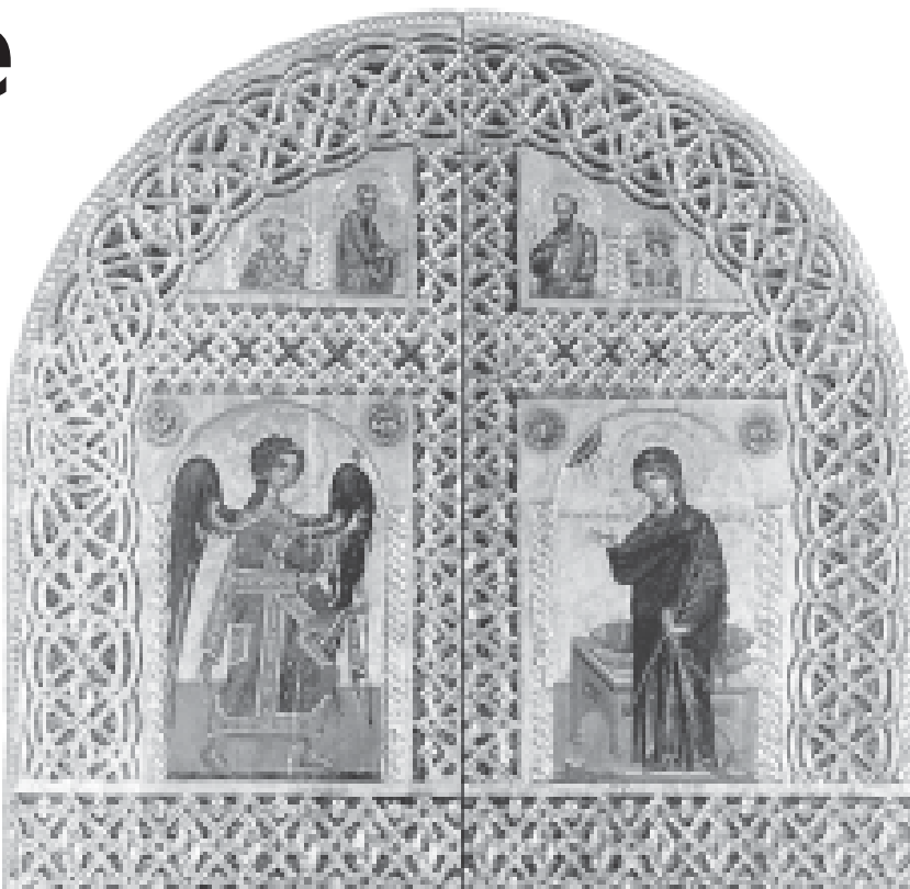
Благовещение. Свещено изображение от XVI в.

Из „Слово за Благовещение на Пресвета Богородица“; Жития на светиите, м. март, манастир „Св. Влчк Георги Зограф“; Света Гора, Атон