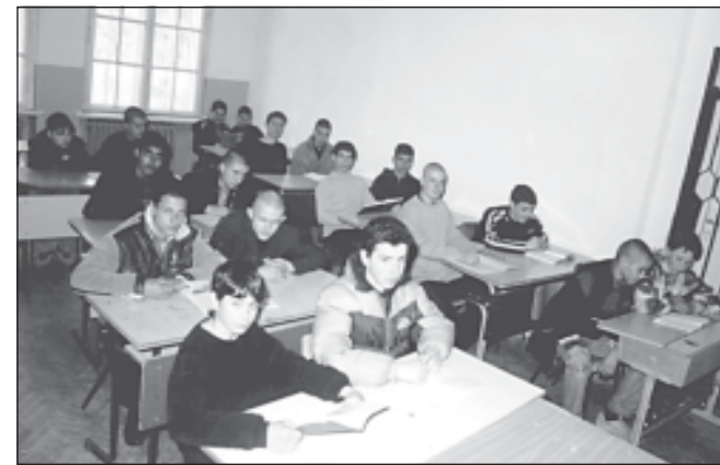
Семинаристите от II курс през учебната 2003-2004 г.