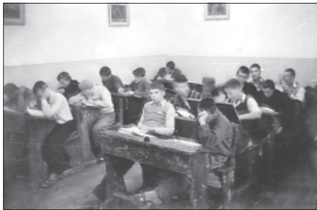
Семинаристите от II курс през учебната 1955-1956 г.