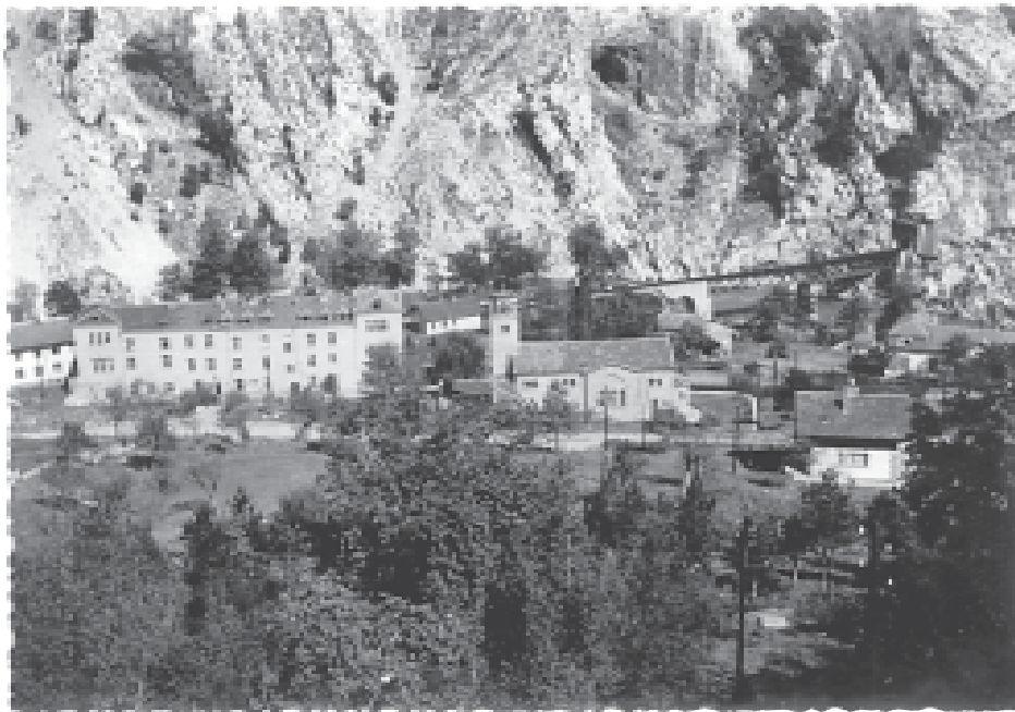
Общ изглед на Софийската семинария, гара Черепиш, 1958 г.

Вестник „Семинарист“ открива рубриката ФОТОАЛБУМ, в която ще се публикуват интересни снимки, съхранени от бивши възпитаници на Семинарията, от техни наследници или близки. Снимките ще бъдат придружени от текст, поясняващ изобразеното на тях и времето, когато са направени. Надяваме се, че чрез ФОТОАЛБУМ ще осветлим неизвестни досега страници от стогодишната история на Со-