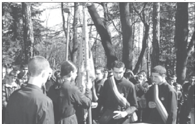
25 март, Благовещение. Тържествено предаване на семинарското знаме от петокурсниците на учениците от четвърти курс