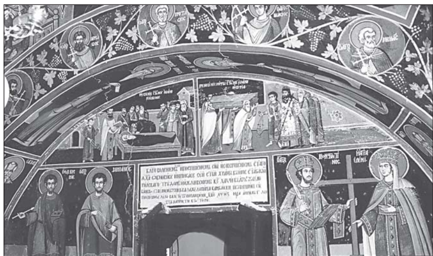
Композиция, съдържаща събития от житието на светеца. Стенопис в параклиса „Св. Йоан Рилски“ в Хилендар

Пример за подобни връзки на дарителство и засилено почитание към образа на св. Йоан Рил-