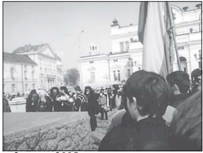
3 март 2005 г., при паметника на Царя-Освободител