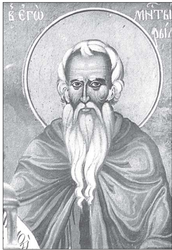
„Св. Йоан Рилски“, XIX в. Стенопис от главната църква „Въведение Богородично“ в Хилендар

Големите български ктитори в миналото – хаджи Вълчо от Банско, хаджи Цвятко от Видин, Димитър и Ангел от Пазарджик, хаджи Найден, Стоян, Петко Моравеника от Копривщица, монасите Кирил и Теодосий от Калофер, проигумена Данаил от Стара Загора и стотици други дарители изграждат, реставрират, изписват или обновяват манастирите в Атон и столетия наред враждат в материалните и духовни пространства на тези оби-