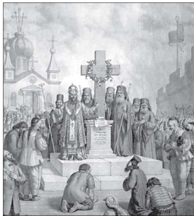
„Паметник за освобождението на Българската църква от Гръцко Вселенската Патриаршия“. Литография, отпечатана във Виена през 1872 г., художник Николай Павлович

След свалянето на Антим I, на екзархийския престол е избран Ловчанския митрополит Йосиф I. Освободителната война (1877-1878) оказва силно влияние върху по-нататъшната съдба на Българската екзархия. Екзархията успява да запази своето седалище в Цариград, което има изключително важно значение. Съсредоточавайки своите усилия в Македония и Одринско, екзарх Йосиф I се заема с две основни задачи: възстановяването на църковното и просветното дело в тези две области. Благодарение на положените от него усилия в Македония и Одринско се изграждат около 1,600 църкви и параклиси, действат около