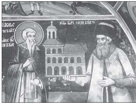
Св. Йоан Рилски и ктитора Хаджи Вълчо. Стенопис от XVIII в. от параклиса „Св. Йоан Рилски“ в Хилендар

Не може да се пренебрегне факта, че Атон и атонските зографи допринасят за обогатяването на образа на св. Йоан Рилски в периода XVII-XVIII в., което се вижда в стенописните композиции в килията „Св. Богородица – Ксилургу“ от средата на XVII в., църквите „Успение Богородично“ (1764 г.) и „Св. Георги“ (1817 г.) в Зографския манастир, както и в предверието на параклисите „Св. Йоан Предтеча“ (1768 г.), параклиса „Свето Преображение“ (средата на XVII в.), паракли-