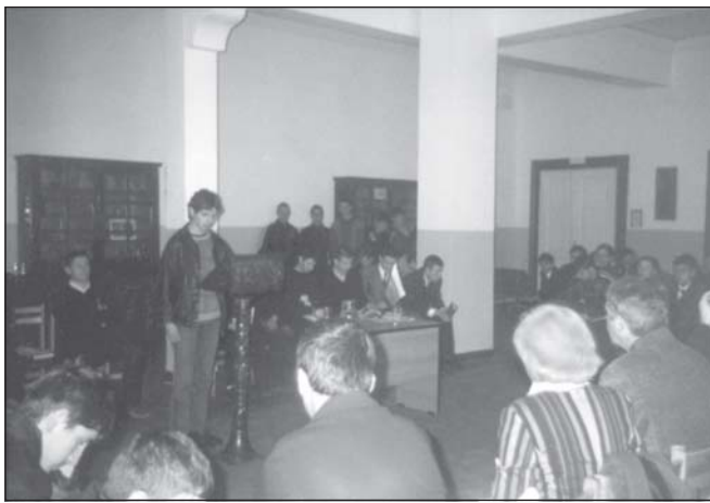
Благовещенски четения 2005 година

На 3 април 1860 г. – Възкресение Христово, когато Иларион Макариополски от-