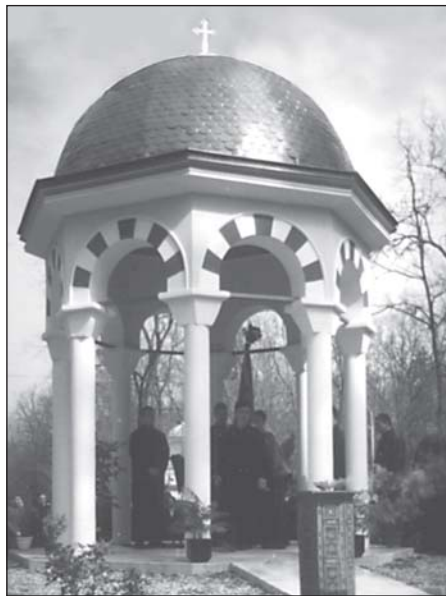
Предаване на семинарското знаме