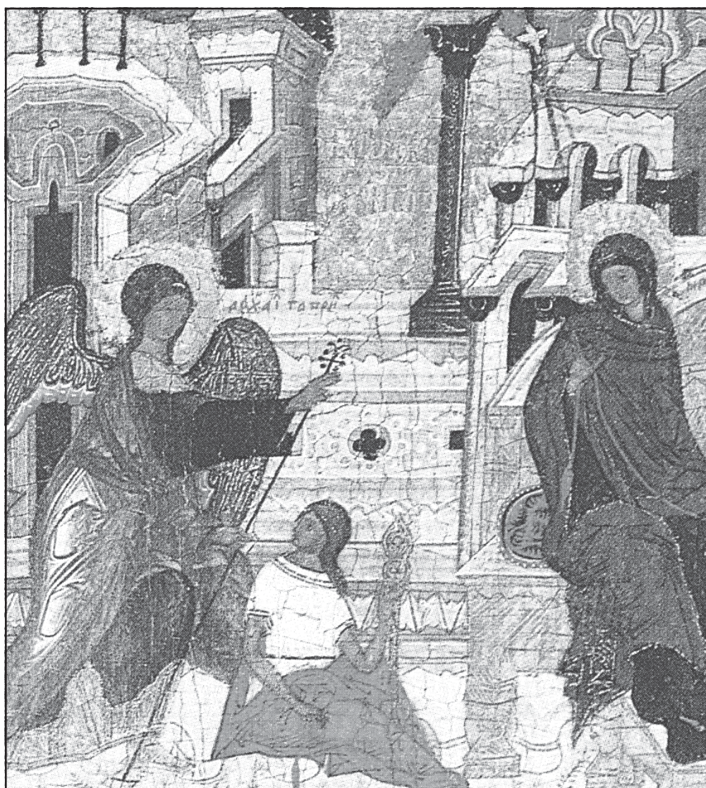
Св. Благовещение. Икона от XVI в.