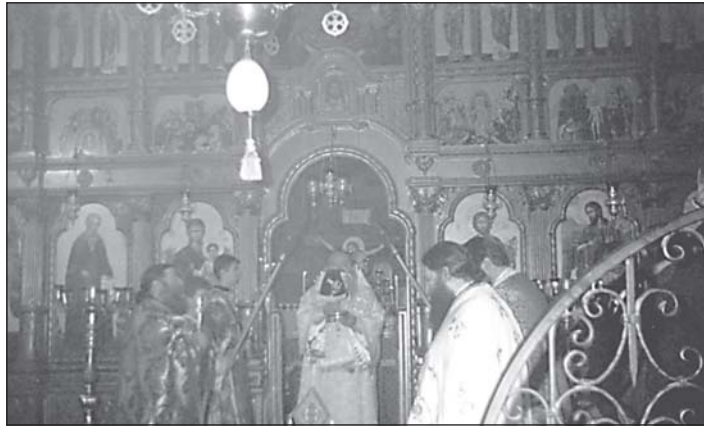
Момент от празничната св. Литургия

Рано сутринта на 25 март, тържествен камбанен звън възвести началото на празничното богослужение в семинарския храм. Негово Високопреосвещенство Ловчанският митрополит Гавриил отслужи светата Литургия в съслужение с Не-