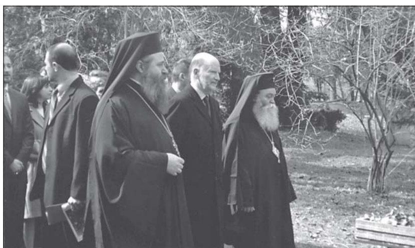
Митрополит Гавриил, премиерът С. Сакскобургготски и архимандрит Сионий в двора на Семинарията