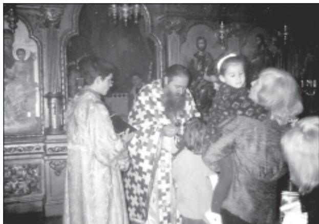
24 април, Цветница. Св. Причестяване по време на празничната св. Литургия в семинарския храм

Икона от фонда на музея при Рилския манастир. Зограф Генчо Филипов, 1857 г.