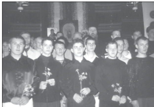
12 май. Архимандрит Сионий със зрелостници от випуск 2005 г.