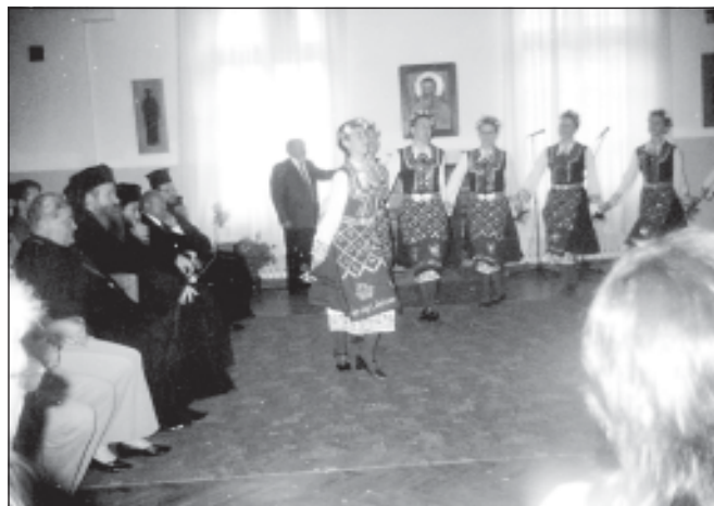
Момент от празничния концерт в Семинарията по повод годишнината от възстановяването на Българската патриаршия