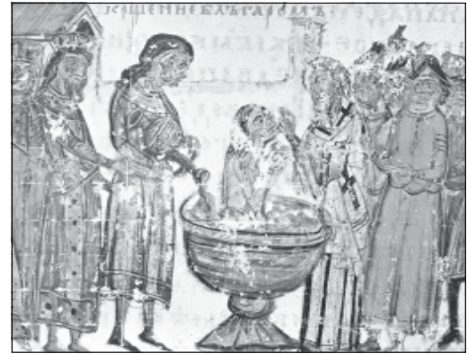
„Покръстване на българите“. Миниатюра от българския превод на Манасиевата летопис, XIV век, Библиотека на Ватикана (л. 163)

Рядко пъти един владетел е така тясно свързан с духовната култура на един народ, както владетелят на българите – княз Борис-Михаил (852-889). Рождената му дата не се знае, но литописците с точност ни казват времето на неговата смърт. Борис поема властта като син на хан Пресиан. Според едно легендарно известие той приел българското царство на р. Брегалница (дн. Македония). Името Борис се тълкува като производно на старотюрското „бор“ (вълк), според други