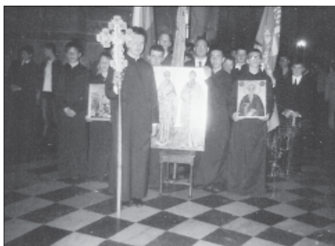
11 май. Възпитаниците на Софийската духовна семинария по време на св. Литургия в храм „Св. Александър Невски“