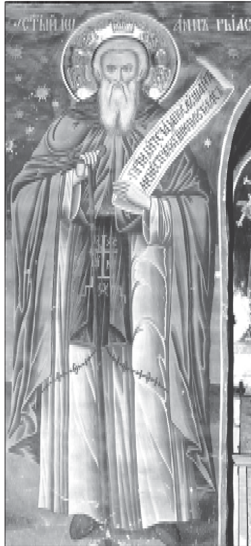
Стенописно изображение на св. Йоан Рилски от пронаоса на главната църква „Св. Георги“ в Зографския манастир

Рилски се намира в преддверието на параклиса „Св. Йоан Предтеча“, което е изографисано през 1768 г. с щедрият дарения на хаджи Василий и неговите синове Недялко и Константин от Ловеч. Типологичните белези, наложени се вече при изобразяването на св. Йоан Рилски и тук ги виждаме спазени акуратно от зографа. Строго изпито лице с вгълбения поглед и дългата бяла брада се налага в цялата композиция. Облечен в тъмночервена към кафяво мантия със схематично изрисувани гънки по дрехата, светецът държи в едната си ръка монашеска броеница, а в другата – навит свитък. Както това изображение на св. Йоан Рилски, така и другото, което се на-