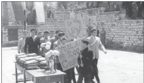
Тържествен марш преди връчване на дипломите на семинаристите от випуск 1960 г.