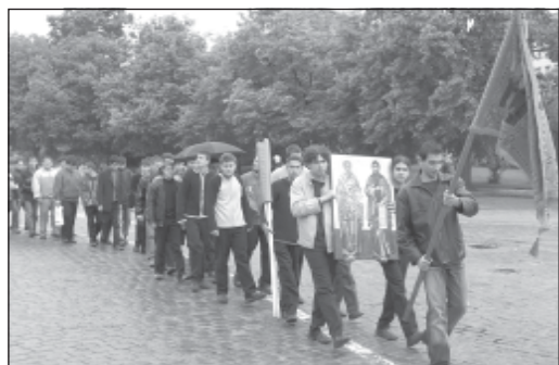
Семинаристи, начело на литийното шествие от храм „Св. Александър Невски“ до паметника на св. св. Кирил и Методий

В ранното утро на 24 май , денят на Българската просвета и култура, и на славянската писменост, възпитаниците на Софийската духовна семинария, по традиция се отправиха към Патриаршеската катедрала „Св.