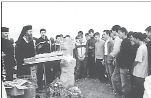
6 юни, Петрови заговезни – освещаване на Кръста край с. Хераково, Софийско

На 6 юни , Петрови заговезни, учениците от I а, I б и II курс на Софийската духовна семинария заедно с отец-ректора Негово Високопреподобие архимандрит Сионий посетихме с. Хераково. Поводът беше въз-