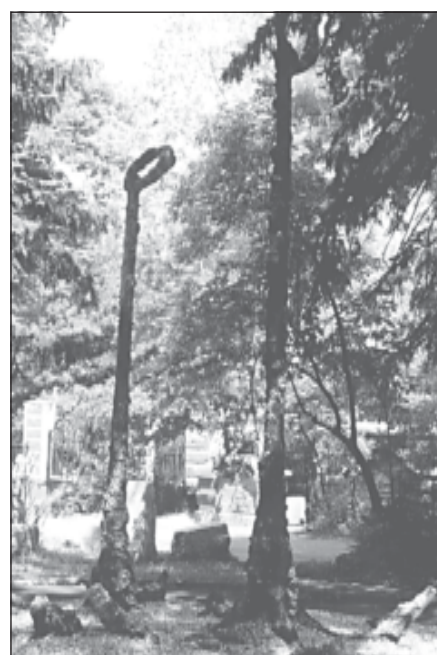
Старинните котви в семинарския парк