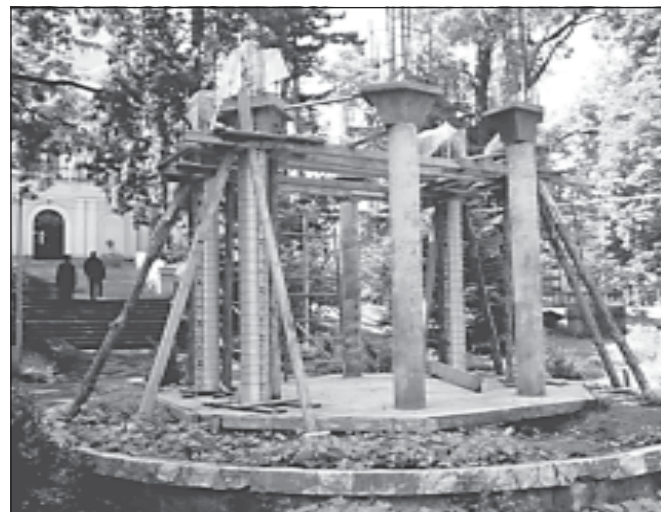
Изграждане на фиала пред централната сграда на Семинарията

Отскоро, в парка на Софийската духовна семинария, пред главния вход на централното семинарско здание, с бързи темпове се съгражда осмоколонна куполна фиала. Думата фиала има гръцки произход и оз-