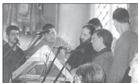
30 май, Петдесетница в Етрополския манастир „Св. Троица“