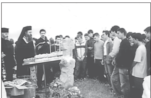
6 юни, Петрови заговезни – освещаване на Кръста край с. Хераково, Софийско

На 6 юни , Петрови заговезни, учениците от I а, I б и II курс на Софийската духовна семинария заедно с отец-ректора Негово Високопреподобие архимандрит Сионий посетихме с. Хераково. Поводът беше въз-