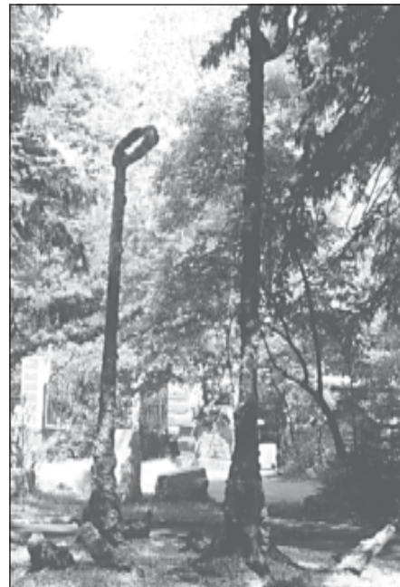
Старинните котви в семинарския парк