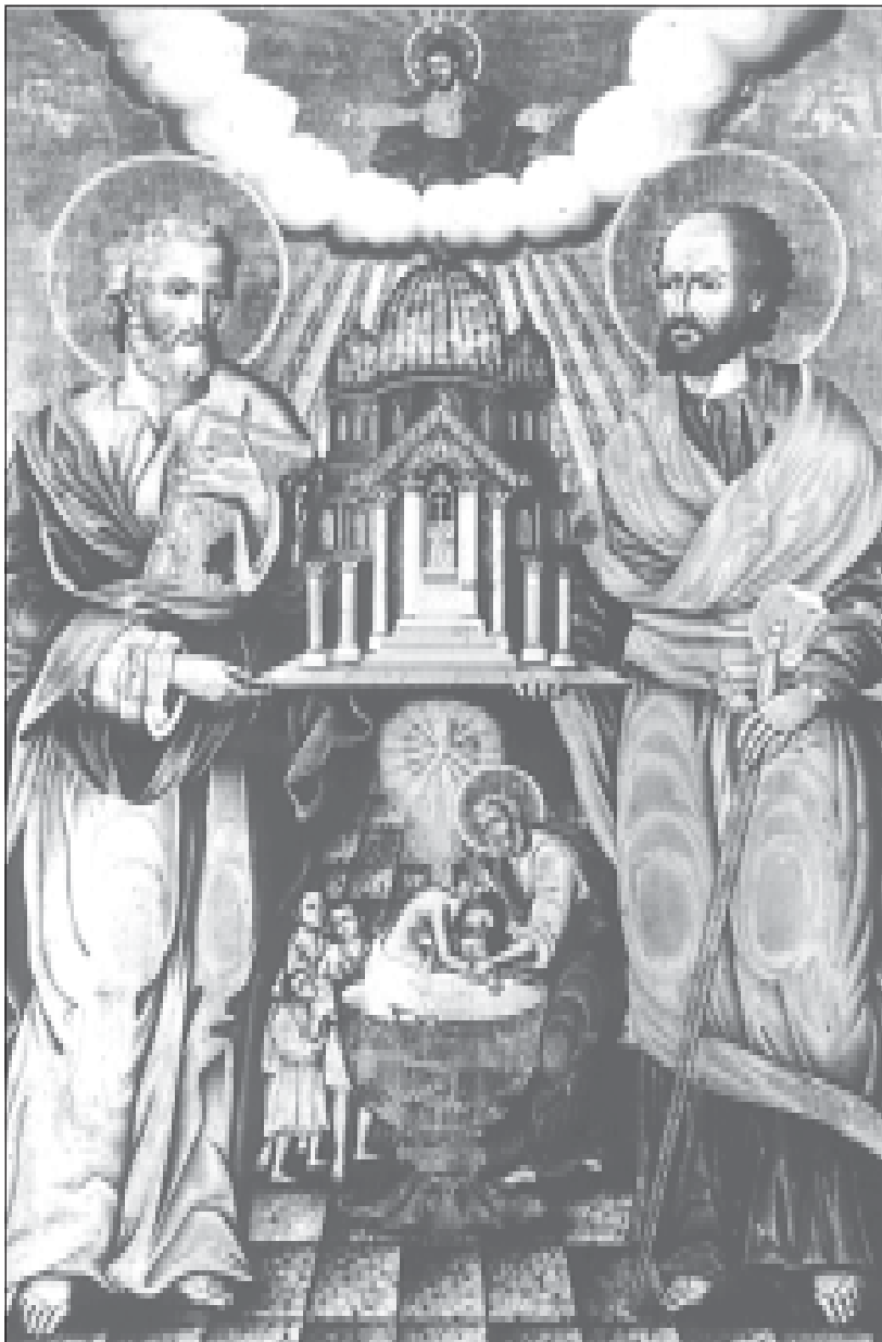
Икона на св. св. Петър и Павел от 1848 г., Пловдивски регион.