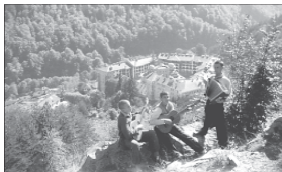
Семинаристи на поклонническо пътуване до Рилския манастир през 1960 г.

Определението „Огледало с памет“ на известния английски фотограф Уилям Хенри Фокс Талбог, живял в началото на XIX в., за откритието на фотографията, остава и днес най-точното определение на феномена фотографска снимка.