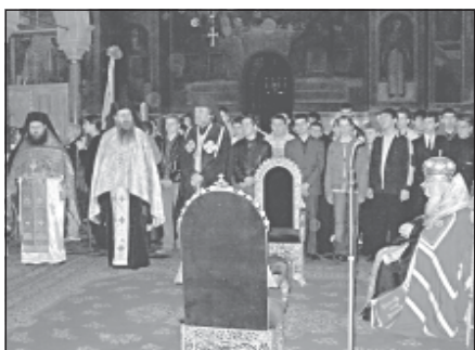
24 май 2004 г. Момент от празничния благодарствен молебен в ШКСХП „Св. Александър Невски“

Ваше Високопреосвещенство, боголюбиви отци, уважаеми господа преподаватели и възпитатели, скъпи родители, възлюбени в Господа братя и сестри! Днешният ден, в който честваме светлата памет на великите апостоли и просветители на вселената светите Петър и Павел, е и ден за особено тържество в нашата духовна школа, ден, в който връчваме дипломите на завършващите наши възпитаници петгодишния курс на обучение и завършващите двегодишния паралелен курс, ден, в който идва ред да берем плодотворите на засятото преди много време и на труда, който сме положили за полза на светата ни Църква. Нека с отворени сърца към Бога и към днес честваните апостоли да благопожелаем голям успех, радост и благодатно удовлетворение на завършващите наши ученици, да им пожелаем изрядна реализация в структурата на родната ни света Църква и много успехи в тяхното служение. Не е случайно, че още от основаването на нашата духовна школа е прието на праз-