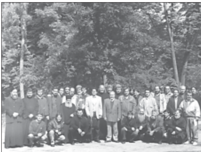
Юни 2004 г. Курсистите от II а и II б паралелни курса, заедно със свои преподаватели