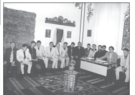
Май-юни 2004 г. Зрелостници в Охридската стая преди началото на изпита по Литургия