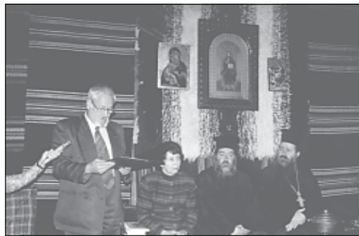
Поздравление от ДАБЧ към 11-те семинаристи, етнически българи

На 14 май , в Софийската духовна семинария, в залата, посветена на старата българска престолнина Търновград, се състоя тържество по повод успешното завършване на петгодишния редовен курс на обучение