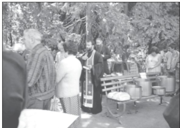
Момент от освещаването на курбана за здраве и успех през новата учебна година