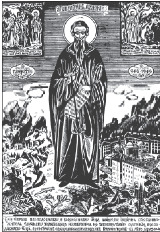
Св. Йоан Рилски.

Този младеж по-късно стана монах и със силна вяра в Господа, просветен в своите знания, но и утвърден в своята вяра, продължи пътя преподобнически на свети Иван. Така Рилският пустиножител е за целия ни народ светилник на вяра и благочестие в трудни и в щастливи дни. Пътеката към Рилската света обител не запустява, защото българският народ знае какво е за него Рила планина и преподобният пустиножител, който я освети със своето присъствие и ни остави завет да пазим вярата Христова, чиста и неопетнена, да не се отклоняваме нито в ляво, нито в дясно, да вървим по правилния път на спасението, и той ще бъде нашият светилник, който ще ни го показва, ще бди над българския народ за да