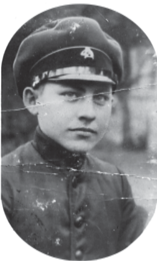
1929 г. В първи клас на Семинарията

Като ученик в Семинарията се стараех да се уча добре и бях един между първите, което ме удовлетворяваше и възкриляваше да продължавам своето учение в Семинарията. Родителите ми ме издържаха с голямо затруднение, ако не е слаба тази дума. Таксата беше 8 000 лв. на година за пансиона. Те нямаша възможност да препечелят тия пари. Баша ми се занимаваше със занаятчийство, известно време беше работник във фабрика, която немците бяха ос-