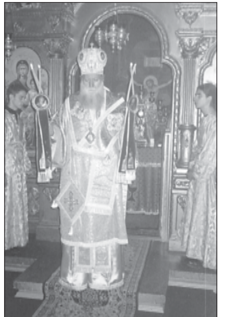
Негово Високопреосвещенство Русенски митрополит Неофит благославя богомолците

нуваме и с благодарност към Бога да бъдем честити в своя живот и служение. Амин. Честит празник!