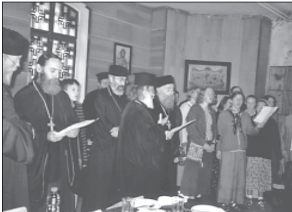
Гостите изпълняват песнопения на английски и на църковно-славянски език

ви благослови и да ви дава крепко здраве.