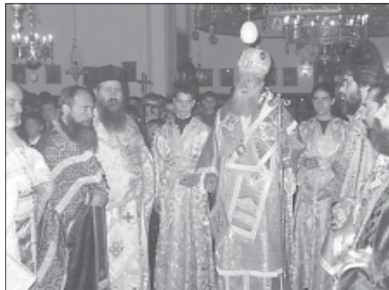
Момент от празничната св. Литургия

можно християнското възпитание – възпитанието в името на любовта и доброто, да бъдат по-силно отразени в нашите училища. А този разсадник на вяра и благочестие – историческата Софийска духовна семинария, нека бъде факел на Христовата светлина и на светлината на преподобния наш отец и пустиножител свети Иван Рилски.