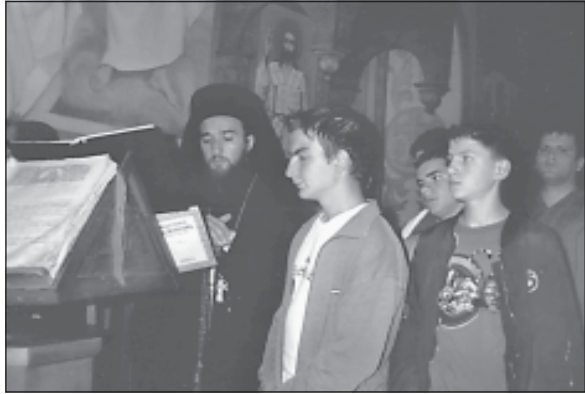
Семинаристите вземат участие в пеенето на клироса

Сам св. ап. Павел е споделял, че той не се храни от подаяние, а от труда на ръцете си. И ние, като апостолски последователи, следваме този принцип, който в голяма степен оформя личността. Oga et labora – казва св. Антоний Велики, т.е. моли се и се труди – това е венецът на монашеския живот. Той е изпълнен от молитва, която молитва се допълва и украсява с монашеския труд. Същото е казано и от светите отци: „молитва без труд е