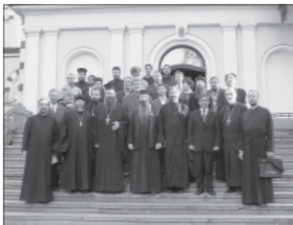
Делегацията от участници в VI конгрес на висшите православни богословски школи пред входа на Семинарията