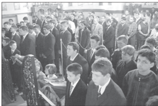
На празничното богослужение в семинарския храм в първия ден на новата учебна година