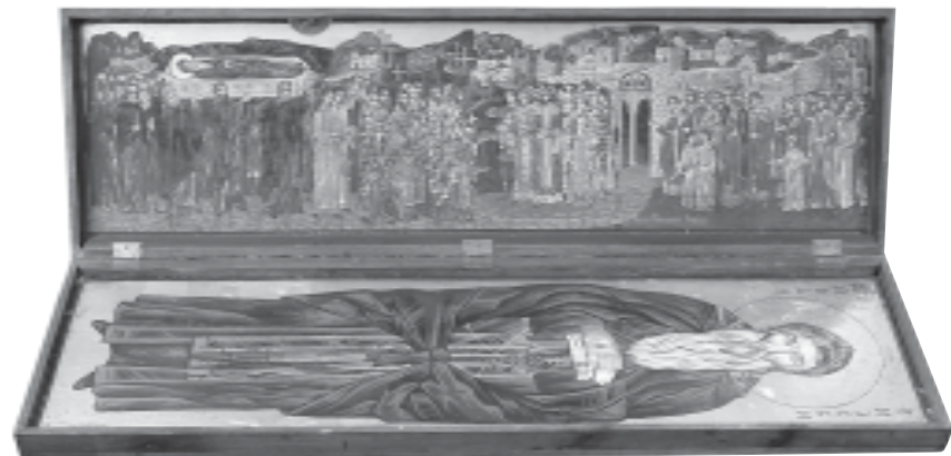
Моцехранителницата, в която се пази частица от св. моци на преп. Йоан Рилски Чудотворец

Из предговора към „Богослужбни последование на все лето преподобном и богоносном отца нашем Иоан Рилском“