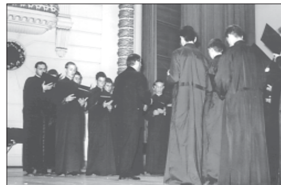
Участие на семинарският хор в юбилейния концерт

На 28 октомври, представителният хор на Софийската духовна семинария взе участие в духовния концерт в зала „Св.София“, посветен на 90-го-