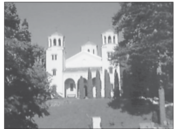
Изглед от манастира

– Манастирът има за свои небесни покровители светите братя Кирил и Методий – най-големият символ на българската просвета във вярата, духовността, културата и книжовността. Това води много хора по пътеката към нашия манастир, защото той е единственият в България, който носи името на светите братя Кирил и Методий. А преклонението към тези две очи на нашата Родина, майка България, е изключително голямо. Говоря от опит. На ден ние посрещаме стотици поклонници у които се чувства сърдечния пламък на вярата и преклонението пред тези свети образи. Традиция на нашия манастир е да контактуваме със Софийската и Пловдивската духовни школи. Още от 1991 г. имаме най-тесни връзки със Софийската духовна семинария „Св. Йоан Рилски“. Тогава игумен на Светата обител беше настоящият ректор на Семинарията Негово високпреподобие