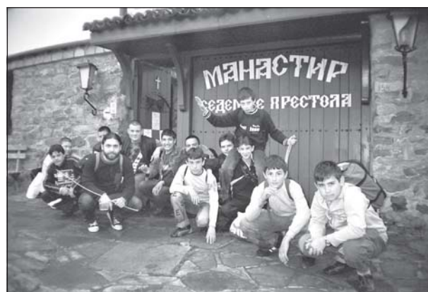
Май 2005 г. Поклонническо пътуване на семинаристите от I а курс. Пред входа на манастира „Седелте престола“