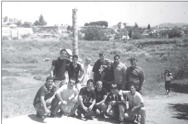
Град Ефес. Пред 3-то чудо на света – храма на Артемидата Ефеска

гобройните си хотели, един от друг по-красиви и по-престижни, със своето небесносиньо море градът заслужено привлича много туристи всяка година. Кушадасъ е космополитен град – за един час на една от главните улици статистици са регистрирали 38 националности. Кушадасъ