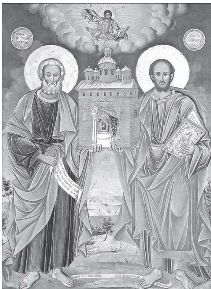
Икона на св. св. Петър и Павел, 1808 г., от митрополитската църква „Св. Троица“ в гр. Русе.

В днешния ден, в който отдаваме почит към великите първоверховни апостоли на светата ни Църква Петър и Павел, сме се събрали в семинарския храм да въздадем благодарност и хвала на Всеподателя Бога за изобилната благодатна щедрост, която излива над нас и над нашите трудове на просветното служение на БПЦ. Събрали сме се и за да връчим зрелостните свидетелства на завършващите ученици и курсисти от випуск 2005-та година – випуск, продължител на традицията на духовното ни средно образование. Та-