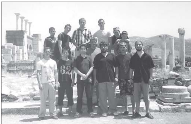
Град Селчук (древния Ефес). Пред гроба на св. Йоан Богослов

векът с едно синьо и едно кафяво око, е изоставен в императорската му шатра при температура 40 градуса. Неговите военачалници се карат помежду си кой да застане начело на империята. Започва бунтът на пълководците за царската корона. Царете се сменят през час, а войни-