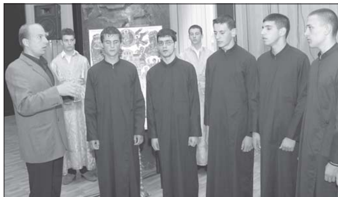
Семинарската певческа група открива Светософийските четения с източно-църковни песнопения пред иконата на Софийските светци, притежание на семинарския храм „Св. Йоан Рилски“