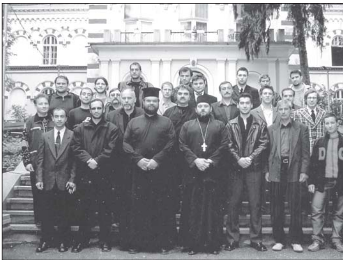
Курсистите от II а и II б паралелни курса, заедно със своите класни ръководители