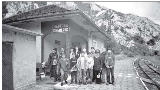
На гара Черепиш – вълнуващо място, свързано с четири десетилетия (периода 1950-1990 г.) от историята на Софийската духовна семинария