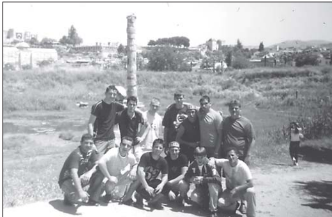
Град Ефес. Пред 3-то чудо на света – храма на Артемида Ефеска

гобройните си хотели, един от друг по-красиви и по-престижни, със своето небесносиньо море градът заслужено привлича много туристи всяка година. Кушадасъ е космополитен град – за един час на една от главните улици статистици са регистрирали 38 националности. Кушадасъ