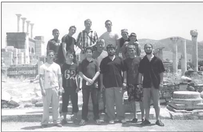
Град Селчук (древния Ефес). Пред гроба на св. Йоан Богослов

Останаха ни последните 18 км до Кушадасъ (Острова на птиците). Със своя прекрасен залив, с мно-