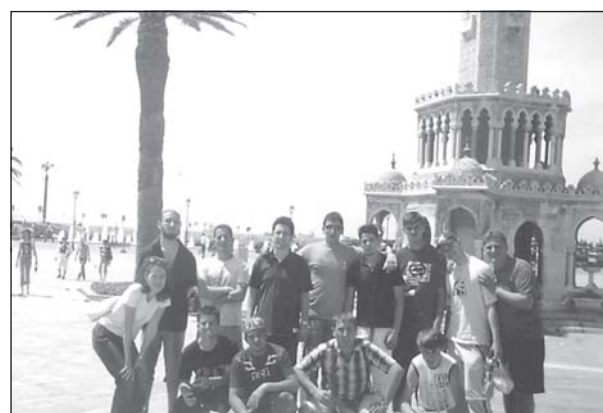
Май 2005 г. Поклонническо пътуване на абитуриентите от V а курс. На централния площад с часовниковата кула в гр. Измир (древната Смирна)