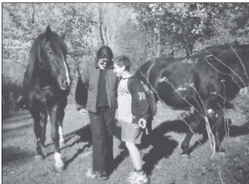
С любимите кончета

Ние, доброволците се опитахме да разберем защо децата толкова обичат да идват в Семинарията, задавайки им въпроси и се оказва, че то най-вече е заради игрите, животните, свободата. А може би дълбоко в тях е проникнала и