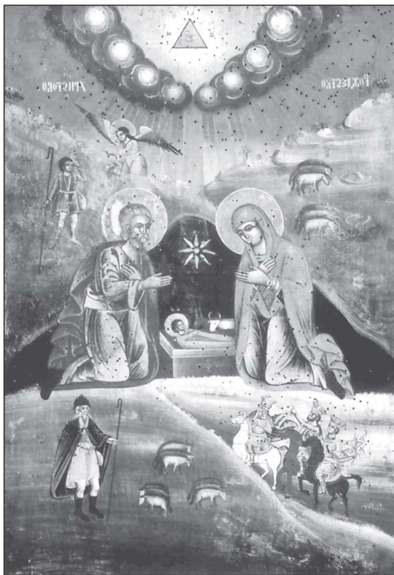
Икона „Рождество Христово“, средата на XIX в., собственост на музея на Тревненската икона, гр. Трявна

Небесният благовестител посочва на витлеемските пастири следния белег за идването на Спасителя в света: Младенец, повит с пелени и положен в ясли. Защото той им казва така: „Ще намерите Младенец повит, лежащ в ясли“ (Лук. 2:11,12) Може би някой ще помисли, че не е голямо това знамение – да се види повит младенец, понеже за всяко новородено е обичайно да бъде повито. Би било велико знамение, ако ангелът, в свидетелството и за ясно потвърждаване на истинността на Христовото Рождество, би показал нещо необичайно, както например на влъхвите – звездата на изток или както сибилата показала на Август девица в слънцето, носеща на ръцете си младенец. Но ако някой поиска да се взгледа с духовното си око в тайнствата, извършващи се в този повит Младенец, той ще види и ще познае, че белегът, посочен от ангела на пастирите: Младенец повит, лежащ в ясли, е велико знамение. Защото този Младенец е Този, Рождеството на Когото откри за света светлината на богопознанието, по ясно от звездите и от слънцето, и пелените Му са по-широки от облаците, яслите Му са по – обширни от небесата, защото в тях лежал невместимият Христос Бог. И така, да обърнем мисления си взор към младенческия вид на Христа. За-