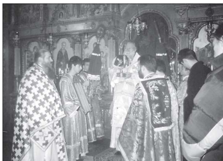
Момент от Божествена св. Литургия в храма на Софийската духовна семинария, 6 декември 2005 г.