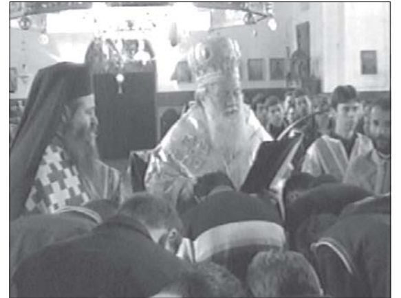
6 декември 2005 г., Русенският митрополит Неофит и архим. Сионий по време на пострижението на семинаристи за четци, певци и свещеносци

От своя страна, като благодарим на митрополит Неофит за вълнуващото слово, ректорът на Семинарията, архимандрит Сионий