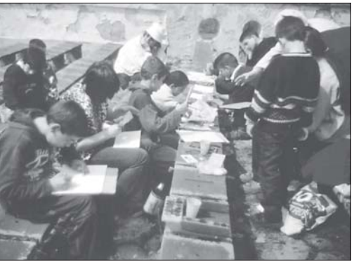
Деца рисуват на скамейките на летния театър в семинарския парк

щи, очакващи... Но начина, по който бяхме приети разсея всичките ни опасения. Архимандрит Сионий ни посрещна с едно достолепие, което се излъчваше от фигурата, от жестовите и с една нескривана любов, която струеше в погледа, в усмивката, в думите.