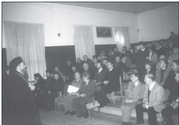
19 октомври 2005 г. Момент от празничния концерт, посветен на патронния празник на Семинарията