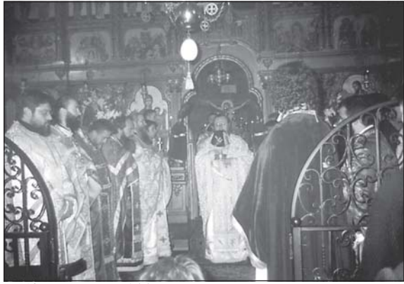
19 октомври 2005 г. Божествена св. Литургия в семинарския храм „Св. Йоан Рилски“

На 19 октомври, денят на преподобни Йоан Рилски чудотворец, тържествено бе честван патронният празник на Софийската духовна семинария. С благословението на Българския патриарх и Софийски митрополит Максим, в семинарския храм, Божествена св. Литургия отслужи Негово Високопреподобие архимандрит Наум, главен секретар на