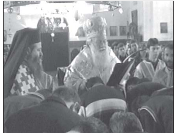
6 декември 2005 г., Русенският митрополит Неофит и архим. Сионий по време на пострижението на семинаристи за четци, певци и свещеносци

От своя страна, като благодарим на митрополит Неофит за вълнуващото слово, ректорът на Семинарията, архимандрит Сионий