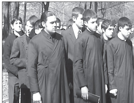
Четвъртокурсниците в очакване на семинарското знаме