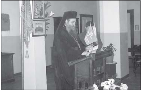
Архим. Сионий открива Благовещенските ученически четения 2006 г.

По-късно, в семинарския храм „Св. Йоан Рилски“ бе отслужено вечерно богослужение с акатист на Пресвета Богородица и петохлебие за здраве и успех на семинаристите от завършващия випуск.