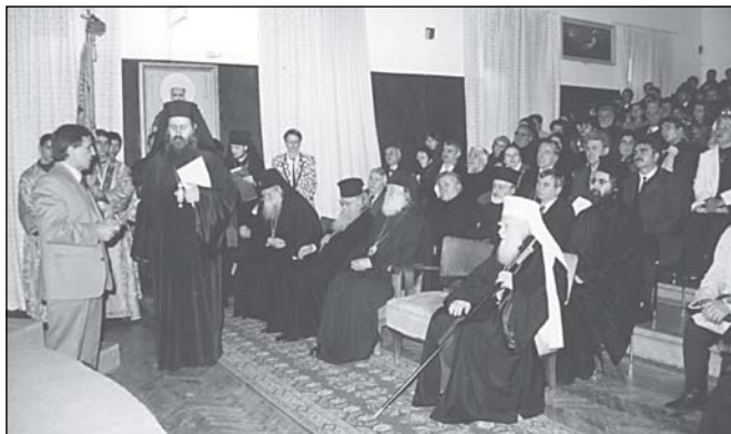
Момент от празничния концерт и приветствията по повод Юбилея

До Ректора Негово Високопреподобие архимандрит Сионий, преподавателите, възпитателите, служителите и възпитаниците на Софийската духовна семинария „Св. Йоан Рилски“