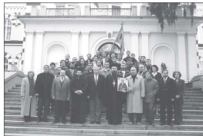
Учителският колектив на Семинарията

Особено ми е приятно да поздравя Вас, уважаеми отец ректоре, учителите, служителите и възпитаниците на Софийската духовна семинария във връзка със стогодишнината от нейното основаване.