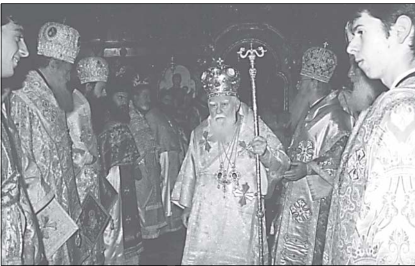
Момент от празничната св. Литургия

Щастлива е нашата Църква, че столетната образователна традиция на Софийската духовна семинария е доказала своето достойно мяс-