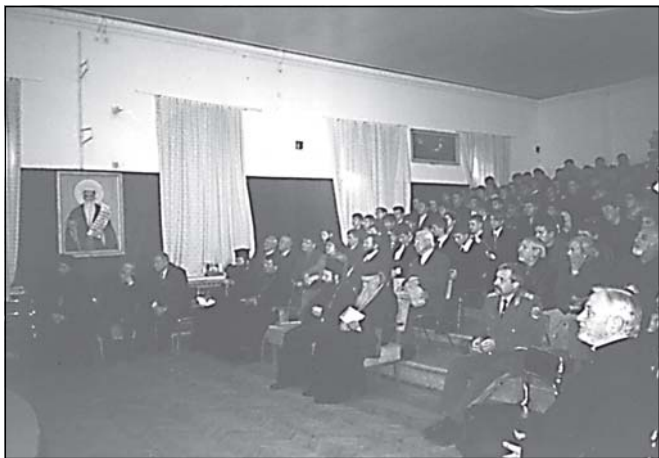
Част от гостите на Юбилейната сесия

На 17 октомври (петък), от 10 ч. сутринта, в зала №1 на централната семинарска сграда се проведе под ръководството на Негово Високопреподобие архимандрит Сионий, ректор на Семинарията, Юбилейна сесия, посветена на 100-годишната история на Софийската духовна Алма матер. Присъстваха Негово Високопреосвещенство митрополит Геласий, Негово Преосвещенство Знеполски епископ Николай, викарий на Софийската митрополия, Техни Високопреподобия архимандрит Серафим, протосингел на Варненска и Великопреславска митрополия, бивш ректор на Семинарията и архимандрит Йоан, протосингел на Софийската митрополия, както и свещеници от столични храмове, видни общественици, бивши и настоящи преподаватели и възпитаници на Софийската духовна семинария, много гости.