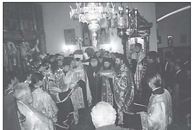
Момент от празничната Вечерня с петохлебие

В края на празничния ден, по традиция, беше отдадена почит към паметта на заслужилите ректори, преподаватели, възпитаници, труженици и дарители на Софийската духовна семинария със заупокойна