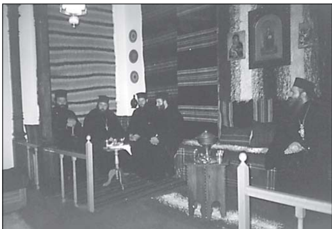
В Търновската стая през почивката между двете заседания на Юбилейната сесия

Сутринта на 19 октомври (неделя), денят на преподобни Йоан Рилски Чудотворец, жизнерадостен и продължителен звън на църковните камбани възвести началото на тържествената св. Литургия, посветена на патрона на Софийската духовна семинария и на нейния 100-годишен юбилей. В украсения с много цветя семинарски храм, Негово Светейшество Българският патриарх и Софийски митрополит Максим отслужи празнична св. Литургия в съслужение с Техни Високопреосвещенства Верейски архиепископ Евгений, Видински митрополит Дометиан, Русенски митрополит Нео-