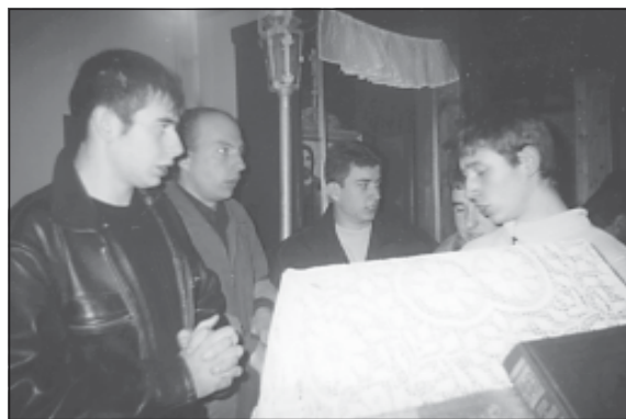
Семинарската певческа група по време на богослужение в църквата „Св. Атанасий летни“, с. Мезек