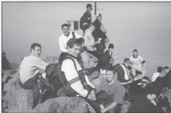
Семинаристи на вр. „Камен дел“, есента на 2004 г.

В Софийската духовна семинария „Св. Йоан Рилски“ наред със задължителната учебна програма се провеждат и много извънкласни дейности и инициативи. Не бих могъл да опиша подробно всичките, но