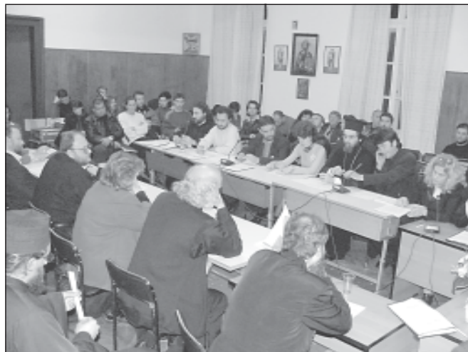
Работен момент от конференцията

Работата на конференцията продължи с доклади