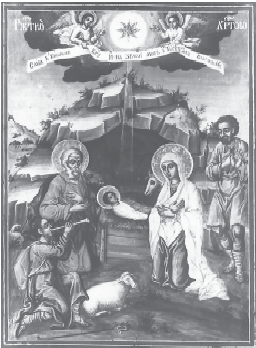
„Рождество Христово“, икона от XIX в., худ. Тома Вишанов – Молера, Банска художествена школа.

Из „Точно изложение на Православната вяра“