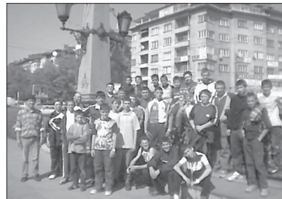
На обиколка из центъра на София, октомври 2004 г.

Най-напред посетихме ПКСХП „Св. Александър Невс-