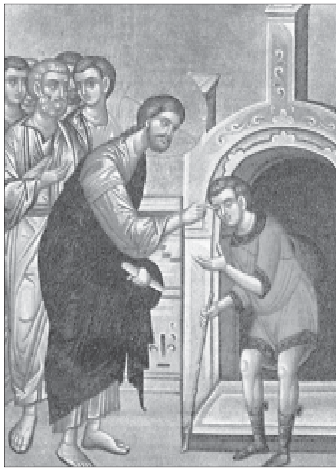
Изцеляване на слепородения.

ни и невинни хора? Не може ли Бог пак с чудо да просвети и духовно слепите? Бог може да стори това, но ако има желание духовно слепите да прогледнат. Ала Спасителят знае, че в тях липсва такова желание, затова допуска и мъките и страданията като една необходимост. Чрез тези изпитания хората могат да дойдат до спасителната светлина. Но за нещастие това не се прави от мнозина. Духовната слепота взема широки размери, тя мъчи хората и