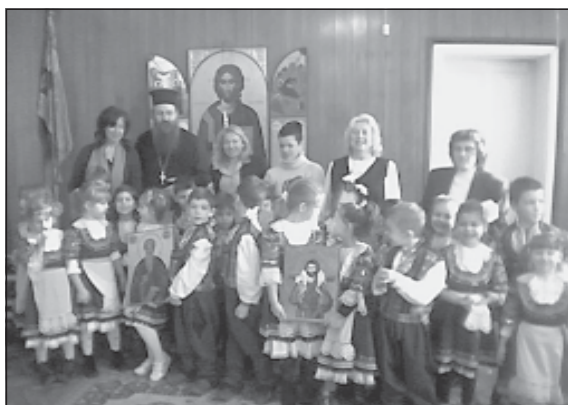
На Игнажден децата първи прекрчиха прага на Ректората на Семинарията