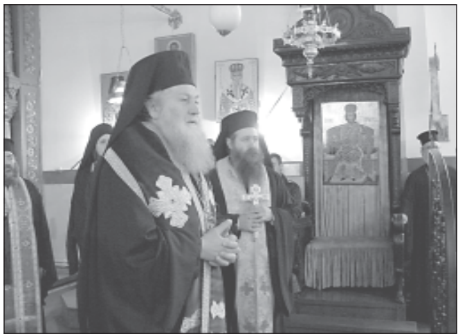
Русенският митрополит Неофит и архимандрит Сионий по време на молебена при откриването на конференцията

От 9 до 11 ноември 2005 г. в Софийската духовна семинария „Св. Йоан Рилски“, с благословието