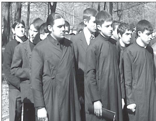
Четвъртокурсниците в очакване на семинарското знаме