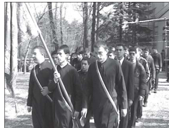
Завършващият випуск предава семинарската реликва на следващия курс

БЛАГОВЕЩЕНСКИ УЧЕНИЧЕСКИ ЧЕТЕНИЯ 2006 г.