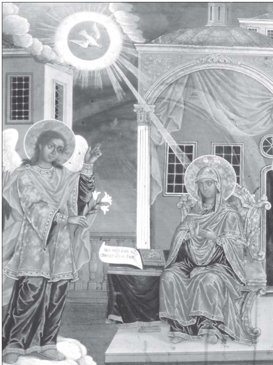
Икона на Свето Благовещение от църквата „Св. Благовещение“ в гр. Разлог, Банска художествена школа, средата на XIX в.

И тази година, празникът на ангелското благовестие за идването на обещания от Бога и предсказан от пророците Спасител на света, бе честван в Софийската духовна семинария с особена тържественост. В навечерието на празника, на 24 март, се проведеха традиционните Благовещенски ученически четения, този път под надслов „Измерения на вярата“. Форумът беше открит от Негово Високопреподобие архимандрит Сионий, ректор на Семинарията: „Имам високата радост и изрядна чест в навечерието на светлия празник Благовещение да открия традиционните Благовещенски четения на Софийската духовна семинария – каза архим. Сионий, – една традиция, която е преплетена с цялостната история на нашата духовна школа, традиция осъвременена и подновена през последните петнадесет години, един духовен порив, хранещ сърцата на преподаватели и ученици в Семинарията, свързан с преблагого и велико събитие на Благовещението, което промени човешкия род и стана изражение на великата Божия милост към нас, човеците.