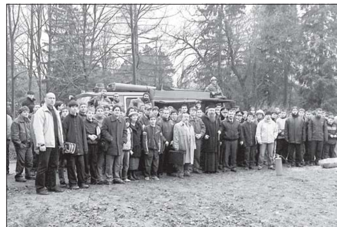
Пред пожарната кола след успешно проведеното учение