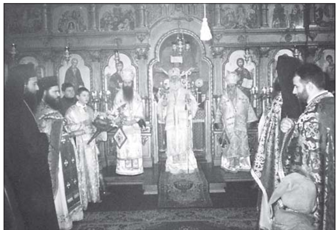
Момент от тържествената св. Литургия

На 22 януари, Неделя 14 след Въздвижение – на Йерихонския слепец, св. ап. Тимотей, прпмчк Анастасий