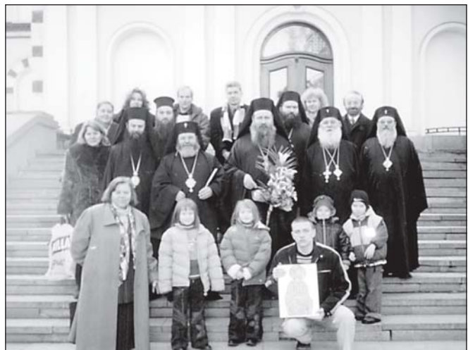
Духовниците, с част от гостите на празника, пред входа на централната семинарска сграда

Перски, свщмчк Петър Български и св. мчк Сионий, в семинарския храм, Божествена св. Литургия отслужи Негово Високопреосвещенство Видинският митрополит Дометиан в съслужение с Негово Високопреосвещенство Плевенския митрополит Игнатий, Негово Преосвещенство Знеполския епископ Николай, викарий на Софийския митрополит, Техни Високопреподобия архимандрит Сионий, ректор на Софийската духовна семинария и архимандрит Йоан, протосингел на Софийска митрополия, Техни Всепреподобия йеромонах Поликарп, игумен на Руенската св. обител, йеромонах Антим, игумен на Клисурската св. обител, йеромонах Антоний, ефиме-