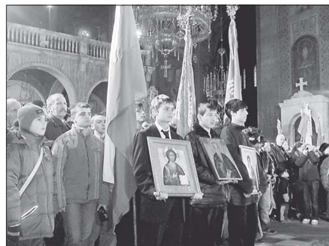
3 март 2006 г. Възпитаниците на Софийската духовна семинария по време на тържествения молебен в ПКХП „Св. Александър Невски“

На 3 март, Националният празник на България, по традиция, и тази година, след утринното богослужение в семинарския храм, възпитаниците на Софийската духовна семинария се отправиха към ПКХП „Св. Александър Невски“ за да присъстват на благодарствения молебен в чест на 128-та годишнина от Освобождението на България от турско робство. В предните редици на семинарската колона бяха учениците, носещи националното и семинарското знамена, Светия Кръст, иконите на Господ Исус Христос и на св. Богородица, на св. Йоан Рилски, както и рипидите. След тържествения молебен, от патриаршеската катедрала тръгна литийно шествие, начело на което застанаха семинарист